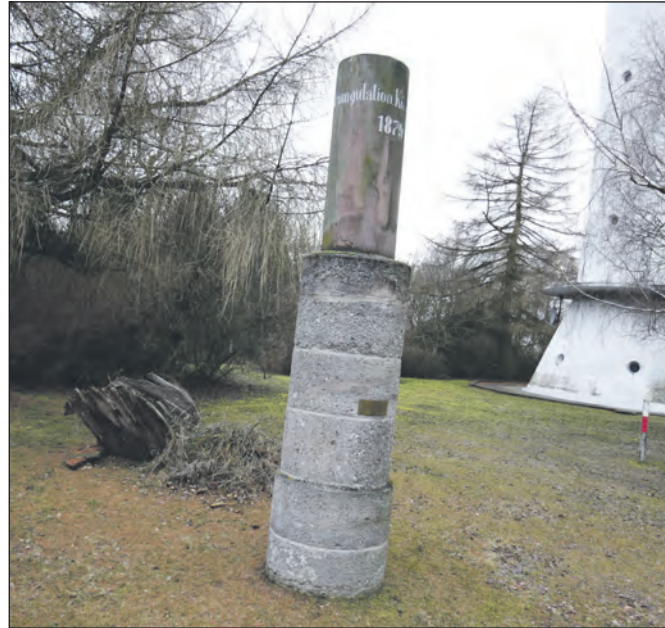
Der Kulpenberg TP.