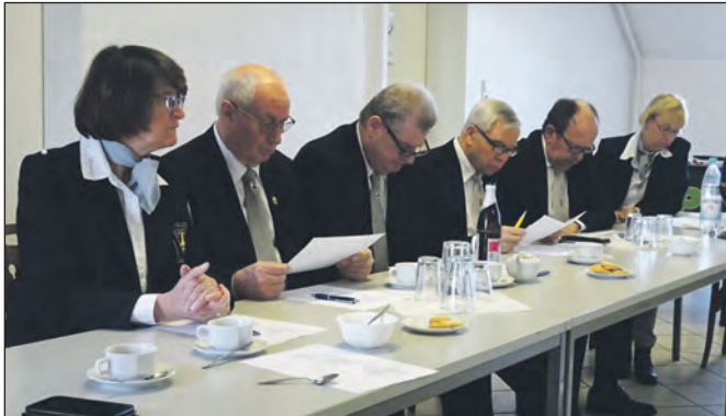
Studium des Haushaltplanes.