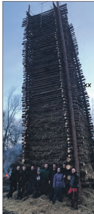
Der große Funken.

ließen die 25 Teilnehmer den Abend kameradschaftlich mit einem Abendessen ausklingen.