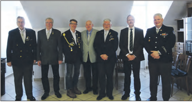
Der neue Landesvorstand.