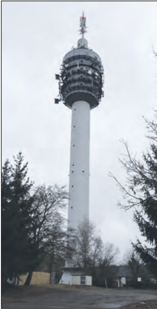
Der Fernsehturm Kulpenberg.