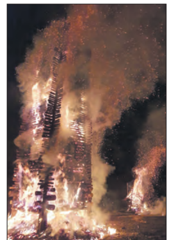
Der brennende Funken.