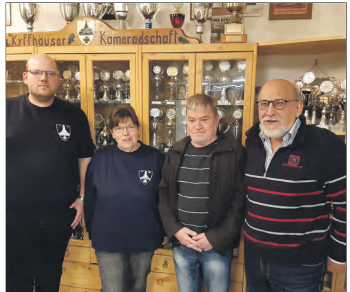
Der Vorstand der KK Berkenthin.