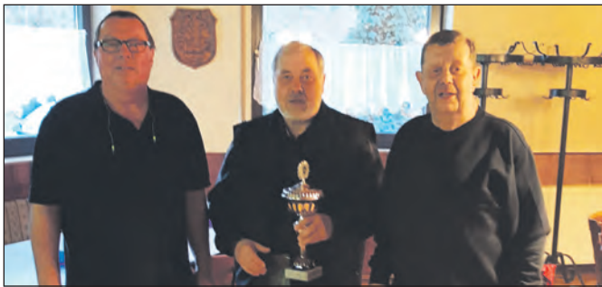
Die Teilnehmer des Pokalschießens.