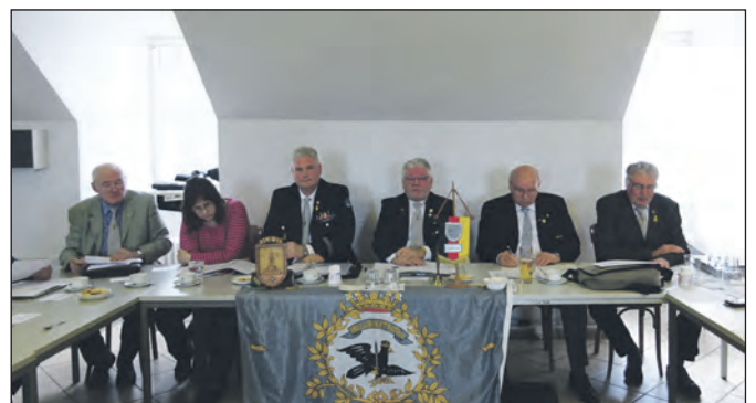
Das Präsidium zur JHV 2020.

Spruch auf den Weg Handle besonnen ist die praktische Seite von: Erkenne dich selbst. Johann Wolfgang von Goethe