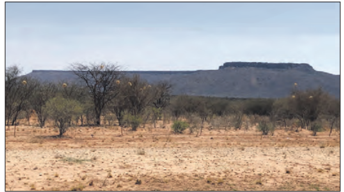
Der „Waterberg“ in Namibia.

August auf dem Soldatenfriedhof am Waterberg. 1907 wurde das Missionsgelände dann an Farmer verkauft und 1972 wurde es als Waterberg Plateau Park unter Naturschutz gestellt.