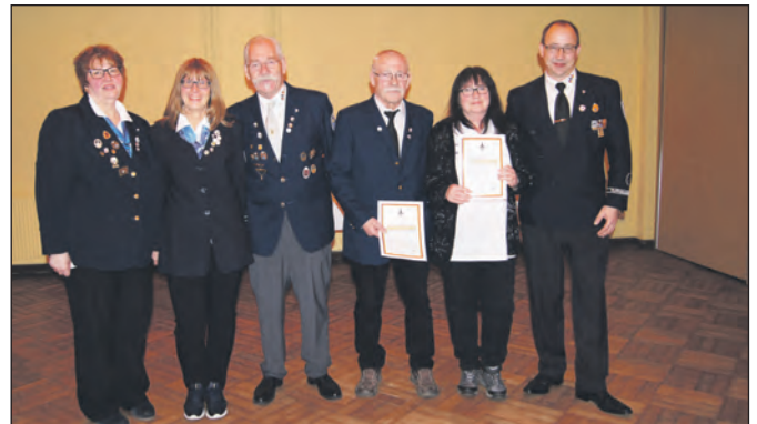
Auf den Bildern sind die geehrten Mitglieder, sowie der 1. und 2. Vorsitzende zu sehen.