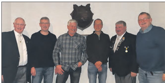
Die Teilnehmer der Jahreshauptversammlung.