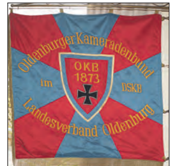
Die Standarte des Oldenburger Kriegerbundes.