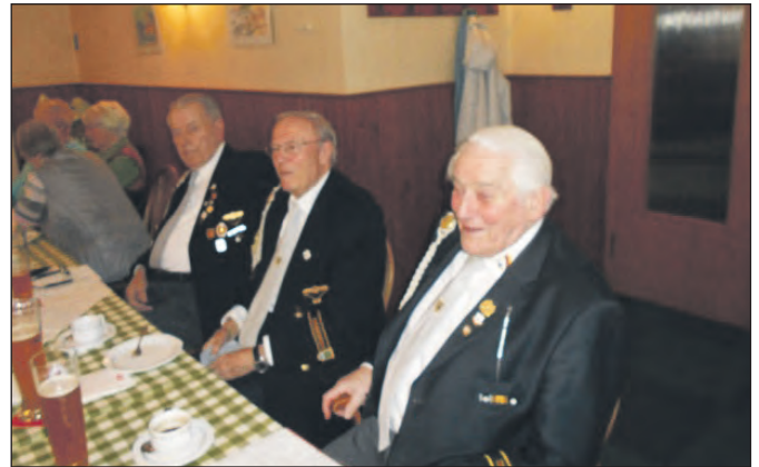
Die Teilnehmer der Jahreshauptversammlung.