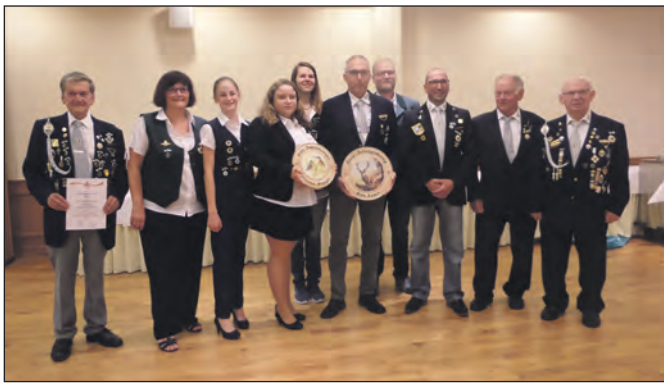
Die Geehrten und Ausgezeichneten.