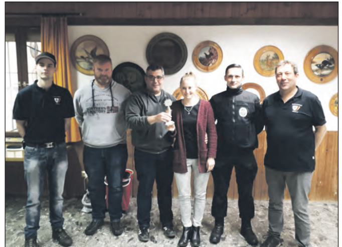
Die Teilnehmer der KK Grüningen.