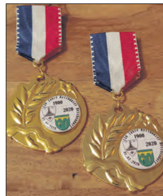
120 Jahre KK Beschendorf.

Mit 600,3 Ringen konnte Beschendorf den 1. Platz bei der Jugend belegen. Bei den Damen belegte die Mannschaft aus Probsteierhagen mit 620 Ringen den 1. Platz. Bei den Herren war der SSV-Kassau mit