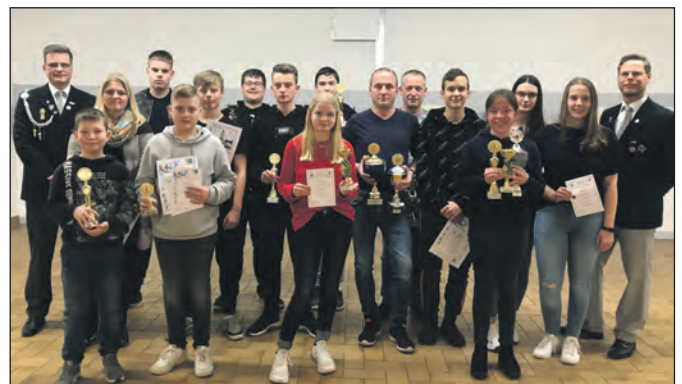
Die Sieger und Ausgezeichneten.