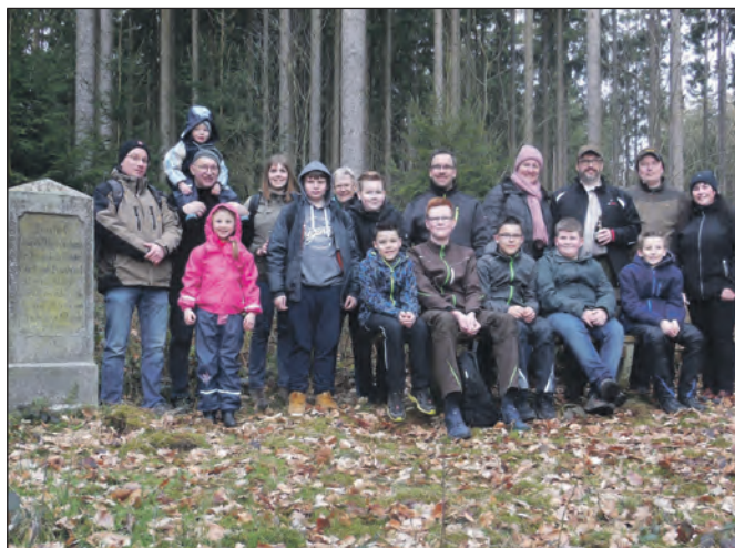
Gruppenbild der Teilnehmer am Klare-Denkmal.

erschossen wurde. Im 19Jahrhundert waren diese Begegnungen keine Seltenheit, die Verarmung und damit auch der einhergehende Hunger der Landbevölkerung trieb manch einen dazu zur Waffe zu greifen und auf die verbotene Jagd zu gehen. Die Schützengruppe ließ das leibliche Wohl auch nicht zu kurz kommen. Am Schützenhaus angekommen gab es leckeres vom Grill. Verschiedene Salate konnten probiert werden und die Muffins waren ebenfalls schnell vergriffen. Alle waren sich einig, dass diese Veranstaltung einen festen Platz im Terminkalender verdient hat.