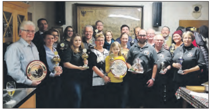
Die glücklichen Gewinner.