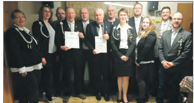
Die Teilnehmer und die Geehrten.