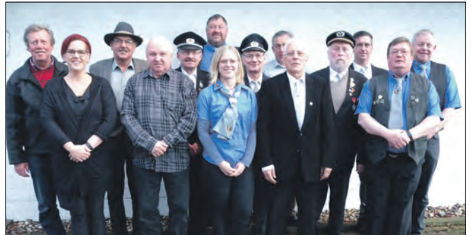
Die Teilnehmer der Kreisdelegiertenversammlung.