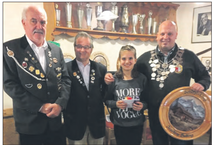
Der neue Schützenkönig und Jugendschützenkönigin 2018.