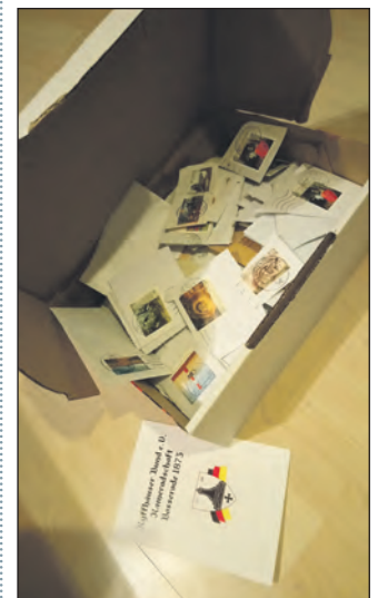
Blick in den Karton.

Auch im vergangenen Jahr war die Kyffhäuser Kameradschaft Bosserode wieder fleißig und hat gebrauchte Briefmarken für den guten Zweck gesammelt. Zum zweiten Mal geht nun ein volles Paket auf den Weg zur Briefmarkenstelle in Bethel. Wir freuen uns erneut einen klei- nen Beitrag für diese Einrich- tung leisten zu können! Das Konzept der Briefmarken- stelle Bethel bewährt sich seit über 125 Jahren und Dank die- ser Spenden konnten viele Ar- beitsplätze für Menschen mit Behinderungen geschaffen werden.