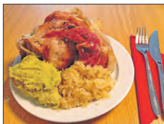
Unsere Portion Eisbein.

Über 70 hungrige Gäste folgten der Einladung am 09.03.19 um 14:00 Uhr, um die schmackhaften „Schweinereien“ zu vernichten. Wer jetzt denkt, dass der Hunger danach gestillt war, konnte sich eines Besseren belehren lassen, denn als gegen 16:00 Uhr Kaffee und Kuchen auf den Tisch kamen, fand auch dieses Angebot einen sehr guten Absatz und zufriedene Gesichter.