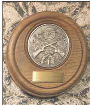
Ehrentafel für die frisch gekürte Schützenkönigin Gintauta Armbrüster.