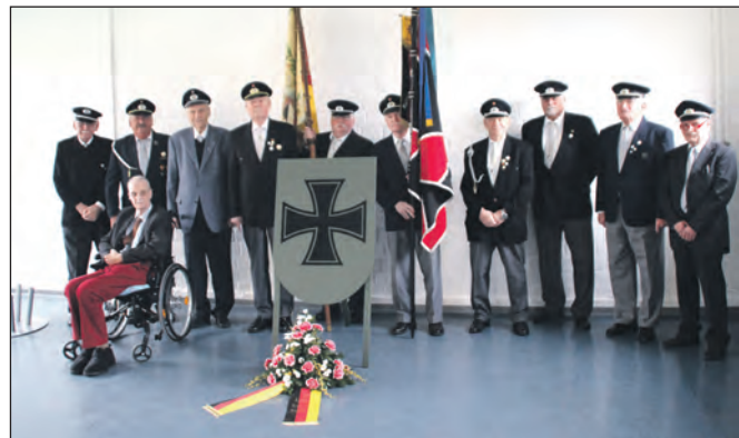
Die Teilnehmer der Jahreshauptversammlung.