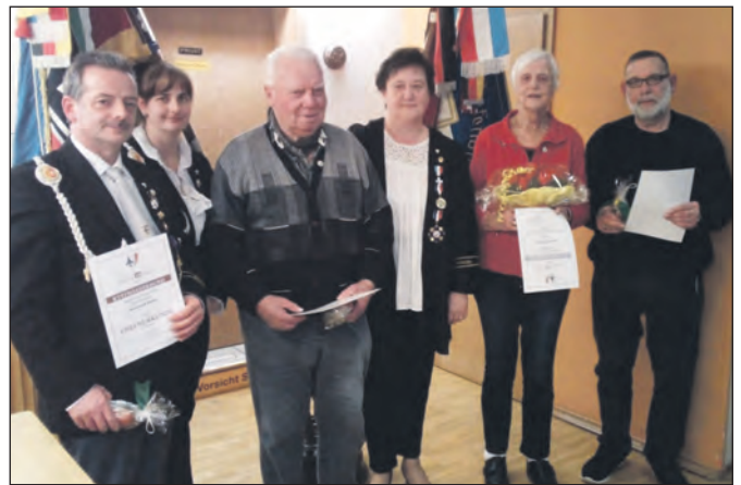
Ehrung der Mitglieder.