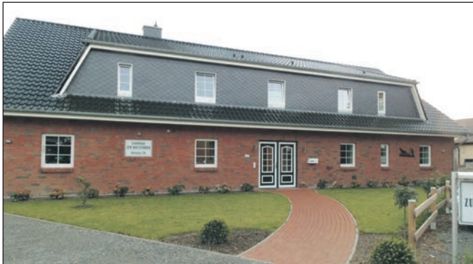
Das Landhaus „Zum Wattführer“.