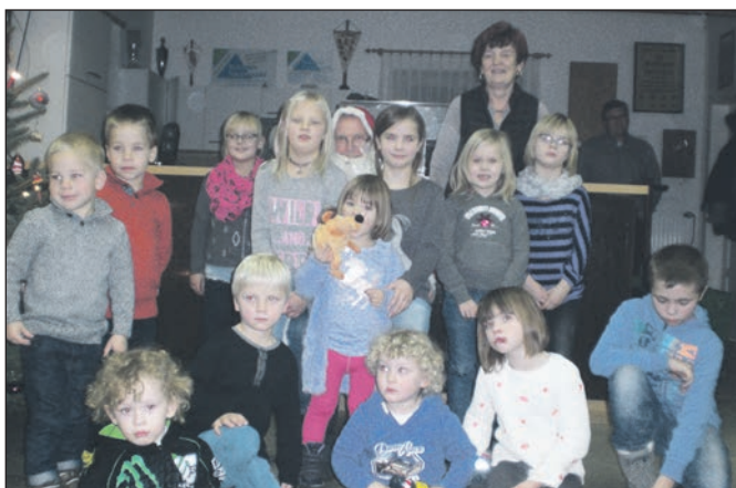
Der Weihnachtsmann besucht die Kleinen.

(Teiler 34,8), Hubert Stigge (Teiler 48,5), Holger Pieper (Teiler 49,3) und Isabel Wege (Teiler 51,5) – alle 30 Ring – die größten Preise. Beim gleichzeitig angebotenen Preisknobeln würfelten Uschi Wagenfeld, Frank Bargemann und Uwe Wendland die meisten Punkte. Sie erhielten einen Präsentkorb und Prozente in Flaschen.