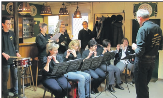
Viel Applaus erhielten die Oldies, die den Sportehrentag des LV Niederelbe, musikalisch untermalten.

Zur Stärkung gab's Kaffee und Kuchen: Groß war die Zahl der Schützinnen und Schützen, die anlässlich des Sportehrentages des Kyffhäuser-Landesverbandes Niederelbe und des Kyffhäuser-Kreisverbandes Uelzen ins Vereinsheim der KK Veerßen gekommen waren. Für die musikalische Unterhaltung sorgten die sogenannten Oldies, das sind ehemalige Mitglieder des Bundesspielmanszuges Veerßen. Sie erhielten viel Applaus, ebenso die erfolgreichen Schützen, die von Landes-