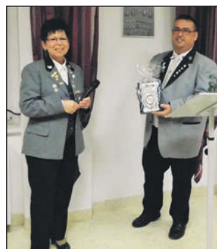
Kameradin Apitius übergibt ein Präsent der KK-Kelbra.