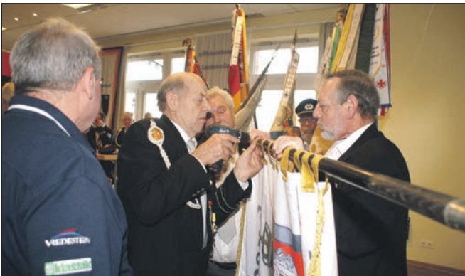
Nageln der Fahne.