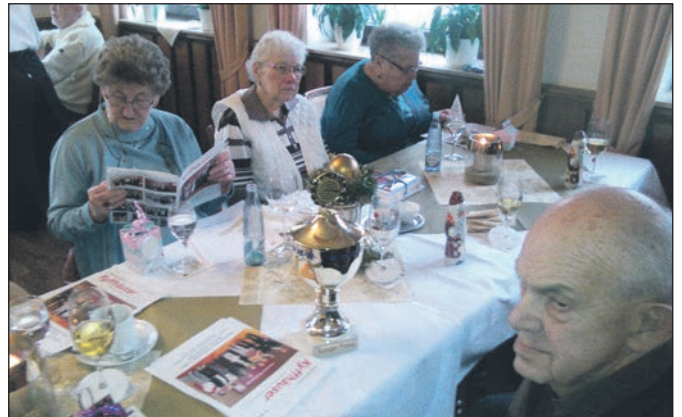
Bei der Weihnachtsfeier wurde die Kyffhäuser-Zeitschrift verteilt und aufmerksam gelesen.