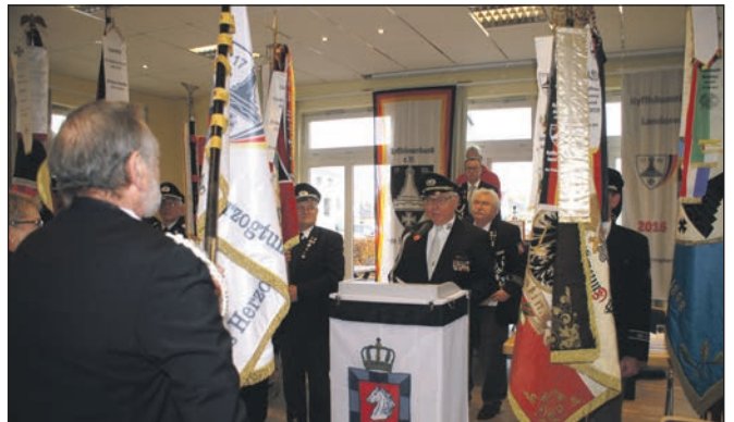
Weihspruch des Präsidenten.