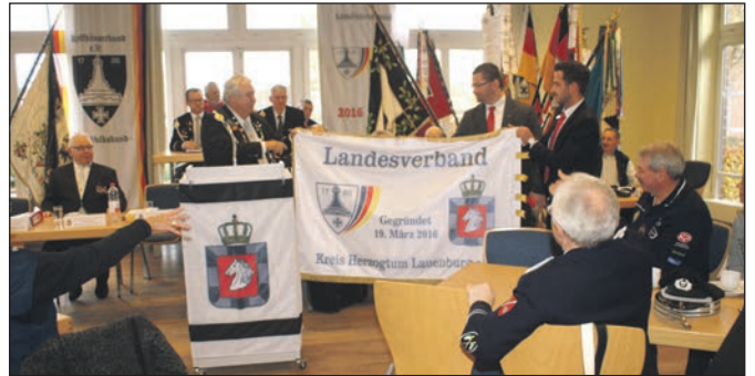
Fahnenübergabe durch KSK.