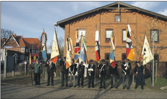
Alle Fahnen des LV vor Ort.