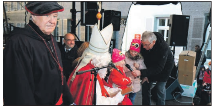
Der Nikolaus zu Besuch.