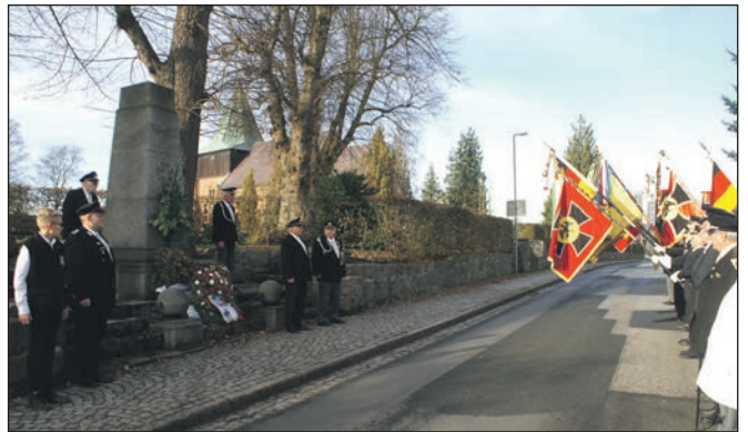
Kranzniederlegungen am Ehrenmal.