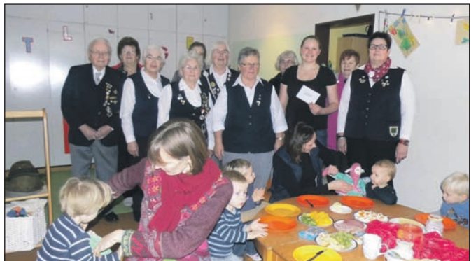
Alle beteiligten Frauen und die Kinder.

den Mitgliedern durchgeführt die einen Betrag von ca. 170,- € ergab, dieser Betrag wurde durch einen Zuschuss aus der Kreisverbandskasse auf 200,- € erhöht und dem Kinderspielkreis Nestlinge in Uenzen als Empfänger der Spende überge-