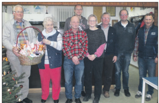
Preisverleihung beim Weihnachtsbratenschießen.