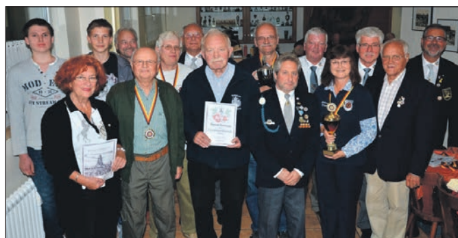
Ehrung der Mitglieder.

auf eine gute Beteiligung vieler Helfer beim Weihnachtsmarkt. Bei netten Gesprächen und einem kleinen Imbiss endete die Versammlung.