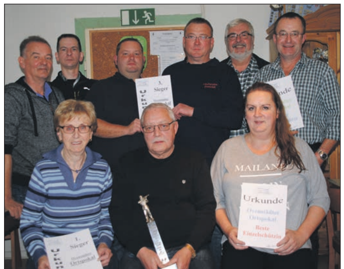
Die Sieger des Schießwettbewerbes.