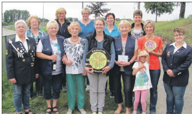
Die erfolgreichen Schützinnen mit ihren Pokalen.