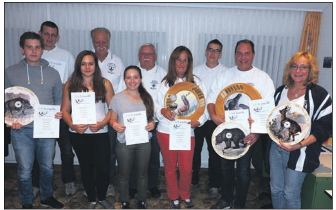
Die erfolgreichen Schützinnen und Schützen nach der Siegerehrung.

Das übliche Vesper beim Abschießen entfiel zugunsten des Lokalbesuchs beim „Zum Alberto“ aus. Bei den italienischen Köstlichkeiten ließen die KK-Schützen den Tag ausklin-