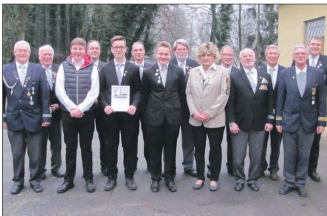
Erfolgreiche Schützen wurden beim Sportehrentag in Veerßen geehrt, unter ihnen auch die Jungschützen aus Altenmedingen (1. Reihe links).