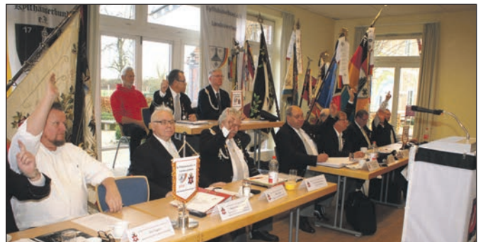
Der Versammlungsleiter lässt abstimmen.