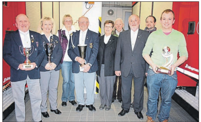
Die Pokalsieger wurden geehrt.

Zudem wurden bei der Jahreshauptversammlung die Pokalsieger des vergangenen Jahres durch