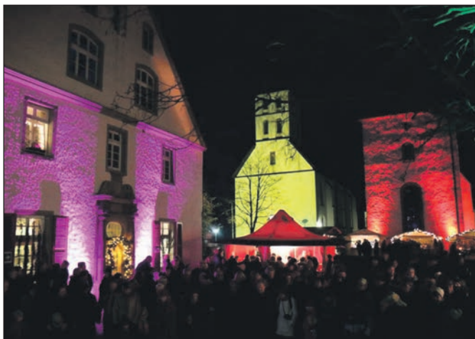
Die alten Fachwerkhäuser und Kirchen in zauberhaftem Licht.