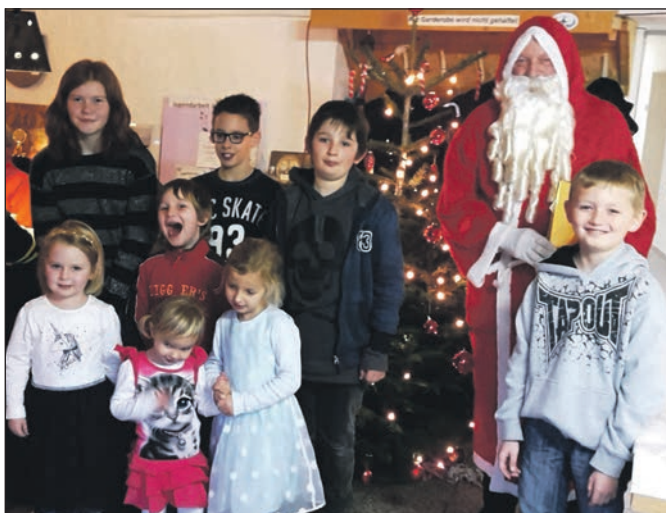
Der Nikolaus ist da!