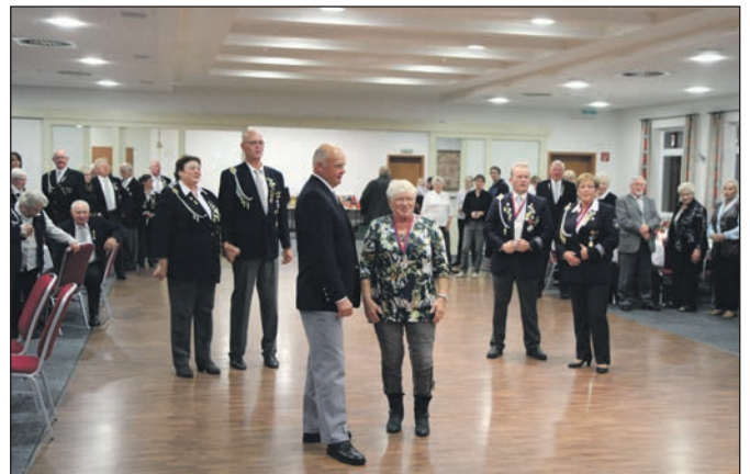
Es folgte ein beschwingter Königsball im „Landhaus Edewecht“.