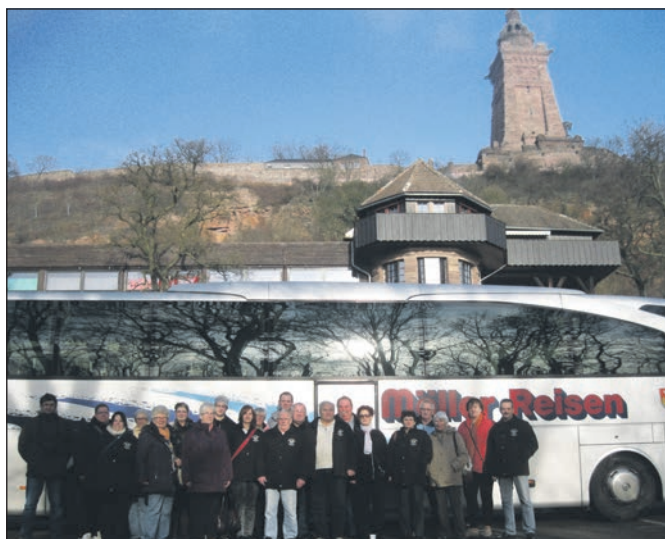
Die begeisterten Teilnehmer der KK Heiligenhafen.

deutlich starker als das Bauwerk in Pisa. Doch alles Schöne geht einmal vorbei und so musste schwerer Herzens die Heimreise angetreten werden. Die erste Vorsitzende zeigte sich sehr erfreut, dass so viele der Einladung gefolgt sind. Bei netten Gesprächen und leckerem Essen verging der Abend wie im Fluge. Ein besonderer Dank ging an den Vereinswirt und seinem Team. Wieder einmal ein gelungenes Grünkohlessen.