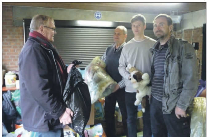
Bei der Spendenaktion kamen viele Sachspenden zusammen.

Die Ehrenwache übernahm wie in jedem Jahr die Reservisten-Kameradschaft Dinslaken-Feldmark. Musikalisch wurde die Veranstaltung von Herrn Cesare