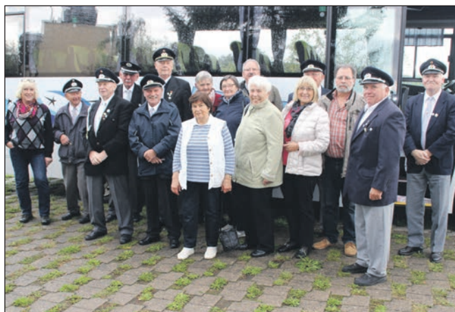
Die Waldecker Reisegruppe vor ihrem Bus.