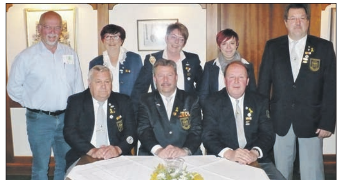
Mehr Stabilität durch Zusammenschluss der beiden Kameradschaften.