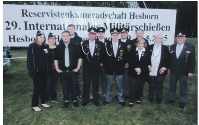
Die Teilnehmer des Militärschießens.

Zur Siegerehrung trafen sich abends alle Mannschaften und mitgereiste Freunde im Schützenhaus der Gemeinde Hesborn. Bis in den späten Abend feierten Soldatinnen, Soldaten, Reservistinnen, Reservisten und zivile Mannschaften aus dem In- und Ausland ausgelassen die Mannschafts- und Einzelsieger sowie den gelungenen Tag. Alle 3 Teams der Kyffhäuser Sportschützenkameradschaft etablierten sich im guten Mittelfeld der Gesamtwertung von 133 teilnehmenden Mannschaf-