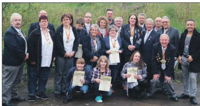
Die Ausgezeichneten der Kreismeisterschaft.

Schützen in Einzel- und Mannschaftswettkämpfen ergattern. Gastgeber Steinbergen-Deckbergen folgte mit 20 Medaillien, davon 8 in Gold, 5 in Silber und 7 in Bronze. Die Kameradschaft Minden erhielt 17 Stück mit 12 mal Gold, 3 mal Silber und 2 mal Bronze. Oberkirchen siegte mit 12 Medaillien, 5 mal Gold, 6 mal Silber und 1 mal Bronze. Rehren verzeichnete 10 Medaillien mit 8 mal Gold, 1 mal Silber und 1 mal Bronze und Auetal immerhin noch 4 Medaillien mit 1 mal Gold und 3 mal Silber. Die Sie-