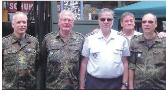
Unsere Kameraden KK v. Tresckow.

Am letzten Maiwochenende fand von Freitag bis Sonntag das 30. Fest der Nationen auf dem Prager Platz in Berlin-Wilmersdorf statt. Gastland war diesmal Israel. Rund um den Prager Platz und angrenzende Straßen waren wieder viele Stände und Bühnen aus fast ganz Europa aufgebaut und hatten interessante Angebote für die Besucher. Schon seit 24 Jahren, also seit ihrer Gründung 1991 sind auch die Kameraden der RK 04 „Berlin-Wilmersdorf“ dabei und seit vielen Jahren in der ersten Reihe die Kyffhäuserkameraden der KK Henning von Tresckow in der RK 04. Auch wieder mit dabei, wie ebenfalls schon seit vielen Jahren, Kameraden der Partnerkompanie,