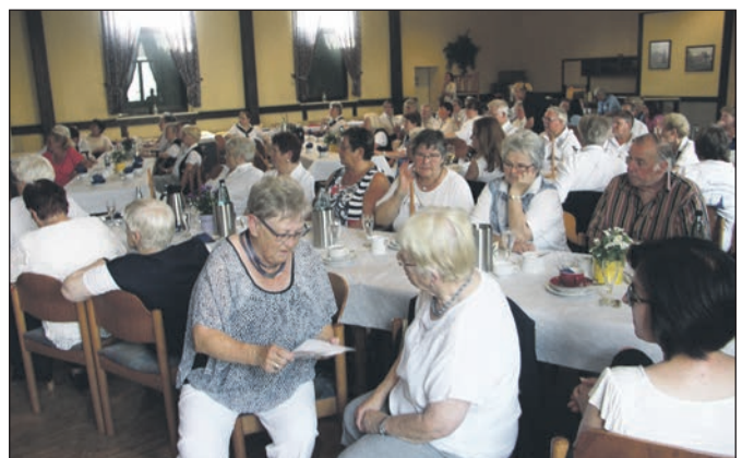
Blick auf die Teilnehmer beim Landesfrauentreffen in Bortfeld.