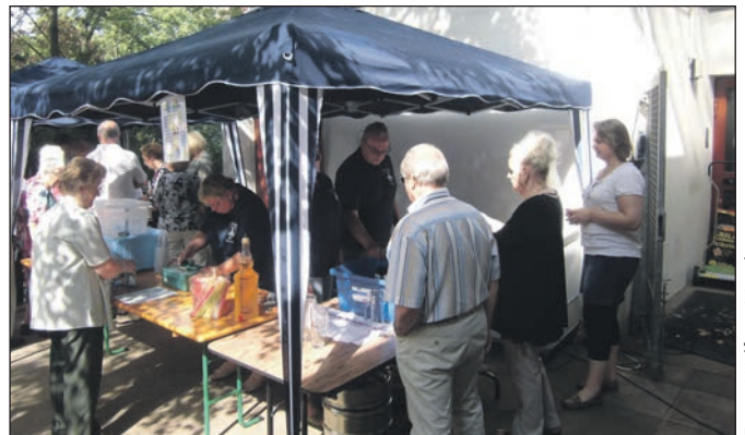
Warten am Tresen.