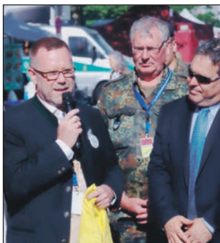
Bürgermeister Reinhard Naumann (li) zu Gast.