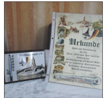
Urkunde und Erinnerungsblatt