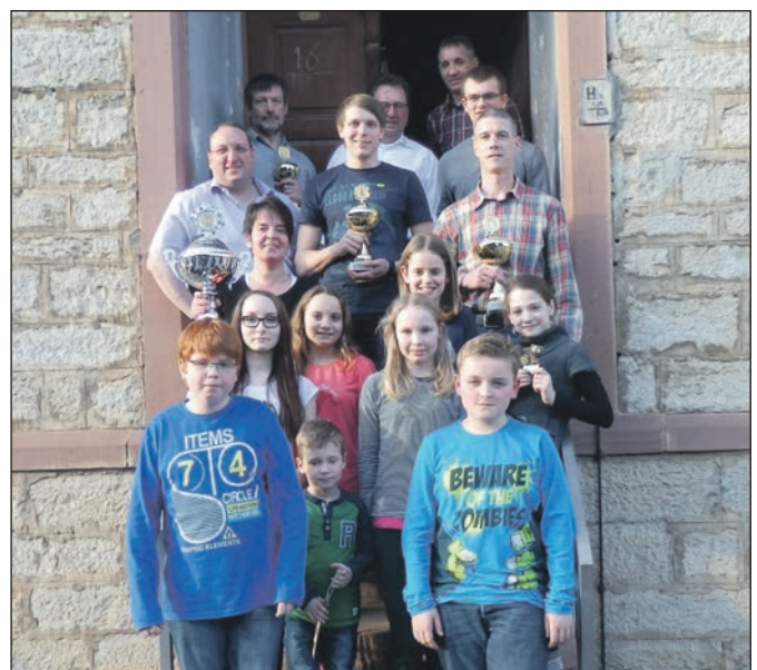
Die Jugendlichen und Erwachsenen zeigten viele sportliche Erfolge.

Der Mitgliederstand zum 31.12.2014 belief sich auf 185, im Vergleich dazu war der Stand