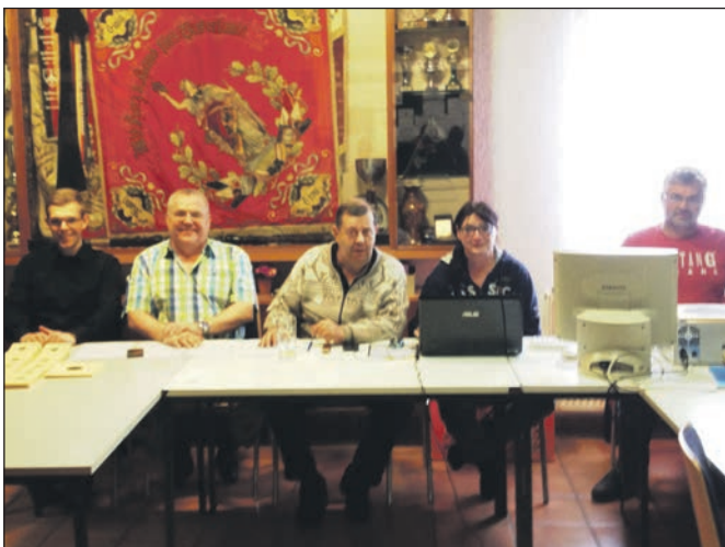
Die Wettkampfleitung bei der Landesmeisterschaft.

Landesmeisterschaften vorbildlich ausgeführt wurden, möchte ich auf diesem Weg danken.