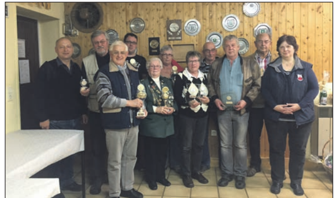
Die glücklichen Gewinner.