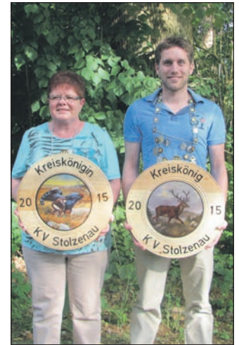
Die neuen Kreiskönige.