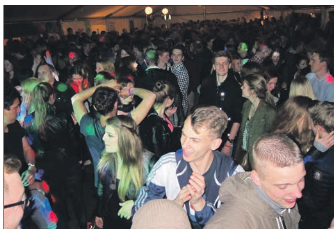
Über 1000 Besucher amüsierten sich beim „Tanz in den Mai“.