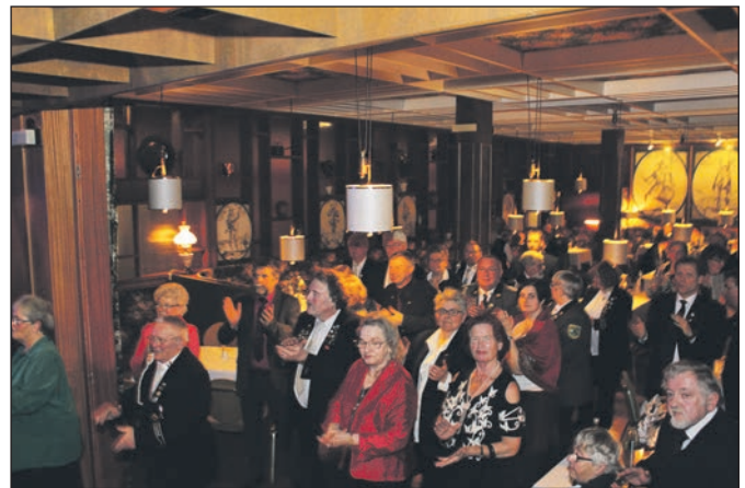
Tolle Stimmung beim 60. Stiftungsfest.