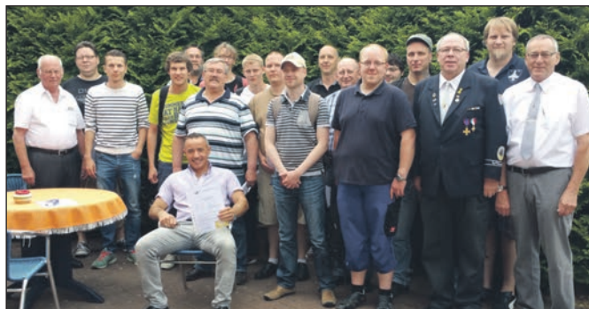
Die erfolgreichen Teilnehmer am Waffen-Sachkunde-Lehrgang.

Der Ausbildungs-Teil 3 fand in Wiedensahl, KV Stolzenau statt. Hier wurden bis zum Mittagessen weitere Themen geschult, bevor es am Nachmittag zur schriftlichen Prüfung, gemäß der Schießsportordnung des KB kam. Beaufsichtigt und kontrol-