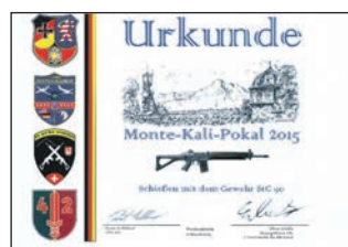
Mannschaftsurkunde MKP 2015

Teams als auch auf die Menge der verschossenen Munition. Seit 1997 wird das MKP durch ausländische Truppenteile, insbesondere durch die US-Streitkräfte, aber auch durch Einheiten aus den Niederlanden, Belgien, der Schweiz und Österreich. unterstützt. Austragungsort war bis zum Jahre 1998 der BGS-Schießstand im Michelsrombacher Wald nahe Fulda. Nach der Schließung dieser Einrichtung wurde nach einigen Jahren der Wanderschaft über Rotenburg a.d.Fulda und Niederweimar bei Marburg mit der „US Army Darmstadt Messel Small Arms Range“ in Messel und jetzt in