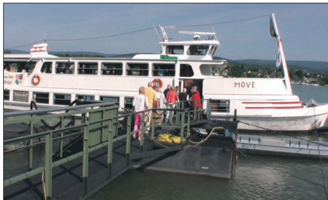
Blick auf die „MÖVE“.

Die Fahrt ging stromauf unter der Schiersteiner Brücke, mit der riesigen Baustelle, hindurch, an der Skyline von Mainz und Wiesbaden vorbei, ins Naturschutzgebiet „Küh-