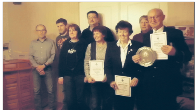
Ehrung der Mitglieder.