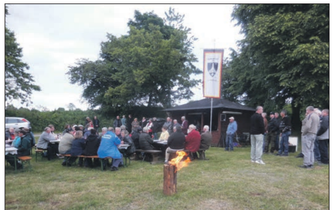
Wärmender Ofen: Ein kleiner Holzofen sorgte für wohltuende Wärme an dem doch recht frischen Abend.