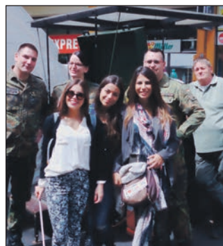
Drei hübsche israelische Soldatinnen mit unseren Kameraden.