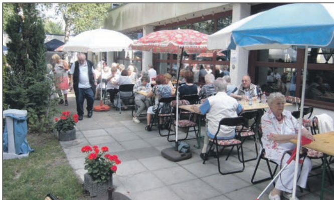
Blick auf die Gäste.