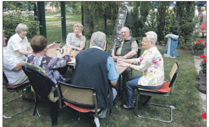
Uns geht's gut hier.