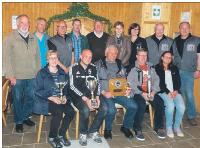
Die Teilnehmer des Ausfluges.

Beim Ausschießen des „König der Könige“, an dem 9 Schüt-