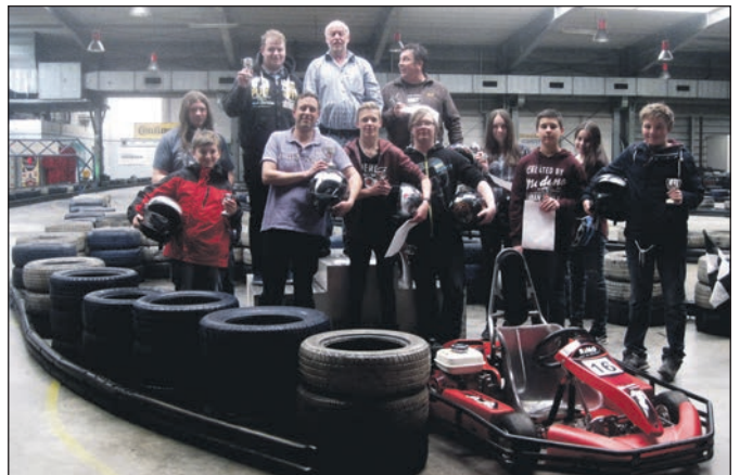
Gruppenbild der Teilnehmer nach dem Rennen in Laatzen.