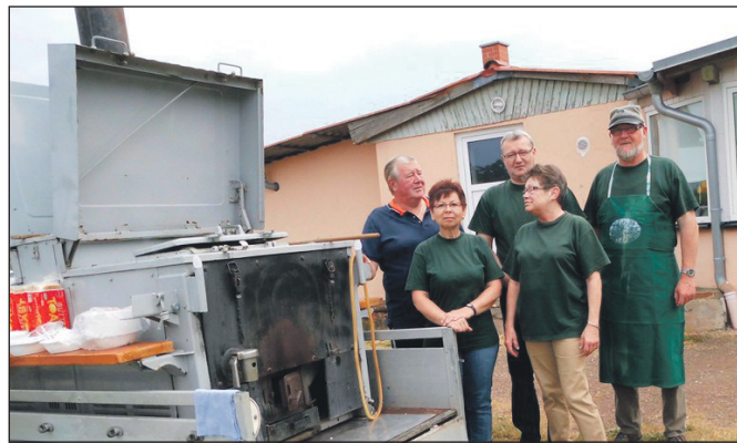
Die Kyffhäuserkameradschaft Kelbra hier zum Fest der Vereine in Kelbra beim Verkauf der Erbsensuppe an der Gulaschkanone.