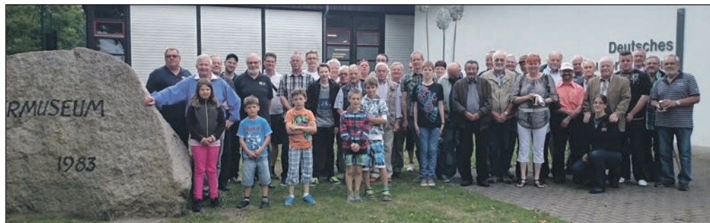
Rege Teilnahme am Besuch des Panzer-Museums.

Landespressereferentin Katja Wagner Buchengasse 6 29308 Winsen Tel. (0 51 43) 67 42 E-Mail: katja.wagner68@gmx.de