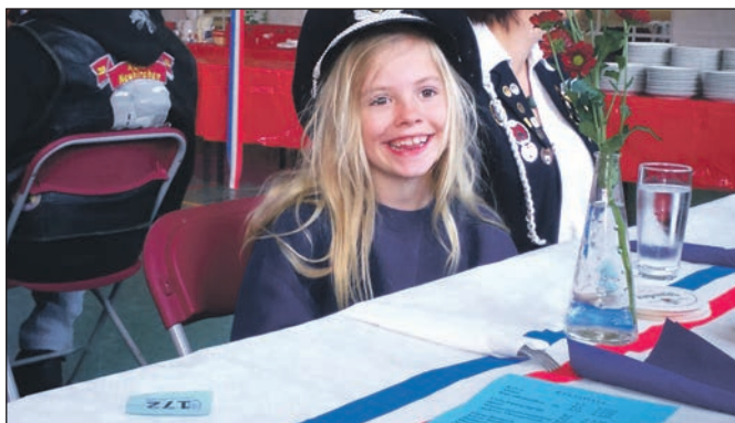
Die Jüngsten sind auch mit dabei.