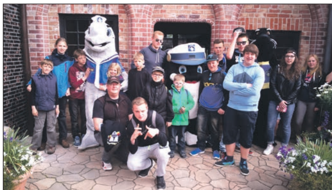
Besuch im Hansapark in Sierksdorf.