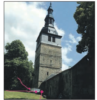
Die Pfeile zeigen, wo in etwa stabilisiert wird.

einstürzen würde. Aber das wollten viele Bürger und Freunde der Stadt nicht und so wurde zu Spendenaktionen aufgerufen um Geld für die Rettung zu bekommen, denn vom Bauministerium Thüringen gab es abschlägige Bescheide. Und nun ist es geschafft, der Turm bleibt. Er wird oberirdisch durch eine Stahlrohrkonstruktion stabilisiert. Groß sind schon die Zukunftspläne, so soll der Turm begehbar gemacht werden, oder auch ein Standesamt eingerichtet werden, um nur einige zu nennen. Dafür wird auch weiterhin Geld gebraucht und Spenden sind willkommen z.B.: Förderverein Oberkirche Bad Frankenhausen, Deutsche Kreditbank IBAN DE9112030000010922441