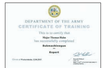
US ARMY Certificate of training „Submachinegun“ MKP 2015

Wackernheim ein optimaler Austragungsort für das MKP gefunden, der es den Ausrichtern ermöglicht, ihren Gästen neben dem Pokalwettbewerb auch eine Vielzahl unterschiedlicher Übungen zum Erwerb